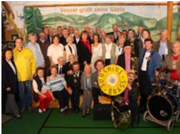
Der Thüringer-Wald-Abend in Vesser war stimmungsvoller Höhepunkt im abwechslungsreichen Begleitprogramm.

Die erfolgreich verlaufende Tagung im CCS wurde von einem attraktiven Begleitprogramm umrahmt, das den Teilnehmern sowohl typisches Sühler Flair als auch Wissenswertes über Thüringen vermittelte. Natürlich stand ein Besuch des Waffenmuseums auf dem Programm. Mit großem Interesse besichtigten die Gäste dessen neu gestaltete